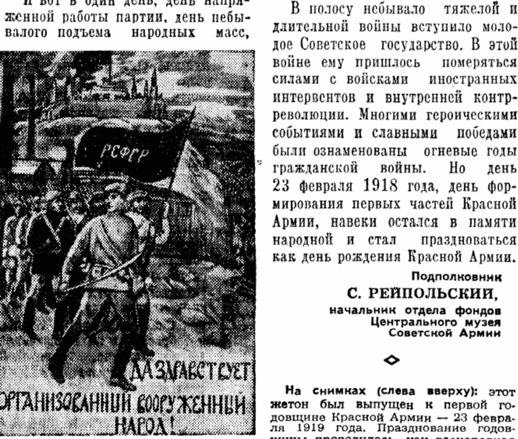
На снимках (слева сверху): этот жетон был выпущен к первой годовщине Красной Армии — 23 февраля 1919 года. Православные священники проводили, как всенародная помощь фронту, и день этот был назван «Днем красного подвояка». Вглядитесь в эти плакаты! (Справа сверху): Они возвращают нас к первым дням рождения Вооруженных сил молодой Советской Республики. Языком суровым и мужественным зовут они рабочих и крестьян укрепить мощь Красной Армии.

И вот в один день, день напряженной работы партии, день небывалого подъема народных масс,