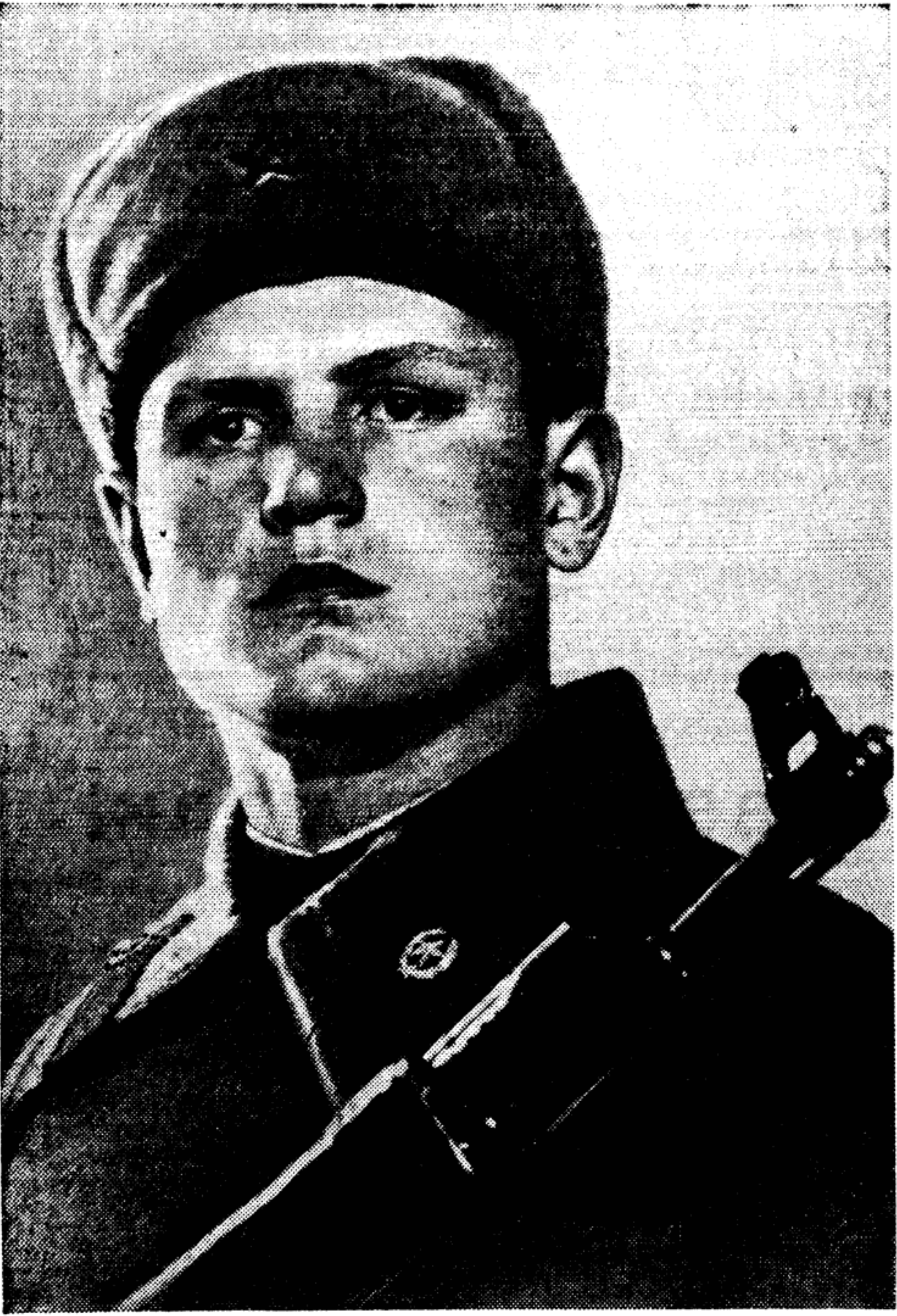
Солдат Страны Советов

ЗАВТРА — 40-ЛЕТИЕ СОВЕТСКИХ ВООРУЖЕННЫХ СИЛ